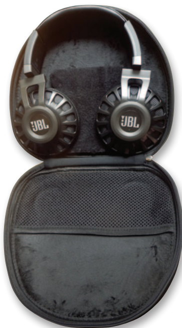
Кей для переноски

Отметив все это, переходим к прослушиванию. Звучание JBL Synchros S700 «напрямую» можно назвать характерным для многих стрит-моделей — несколько «зажатая» середина, ограниченный верх при роскошном басы — разработчики отдельно отмечают внедренную в изделия Synchros технологию JBL PureBass (пассивный и активный режимы) и стоит отдать должное — бас действительно хорош. А теперь нажимаем на центр левой чашки, отчего на нем загорается белый индикатор и включается режим JBL LiveStage — кстати, встроенный ионно-литиевый аккумулятор рассчитан на 28 часов звучания в этом режиме. Звуковая картина разительно меняется. Звук — открытый, активный, по-прежнему радующий превосходной полновесной прорисовкой нижнечастотного диапазона, но при этом демонстрирующий активное, интересное звучание во всех регистрах — превосходен женский вокал, мужскому, пожалуй, чуть не хватает сдержанности в верхних сибянтах, хороши медные духовые, интересно звучание гитарного рока, вплоть до самых агрессивных вариантов. Возможно, чуть не хватает чего-то в самой верхней перкуссии, но все это с лих-