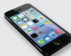
Смартфон iphone 5s