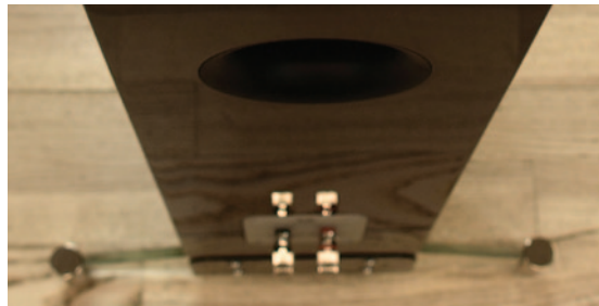
Порт фазоинвертора обращен назад

Динамики Концерт 40 (25-мм купольный твитер и пара СЧ/НЧ-излучателей диаметром 125 мм) укомплектованы мощными, негабаритных размеров магнитами, причем фиксация драйверов имеет свои особенности, направленные, в частности, на дополнительное снижение частоты резонанса. Результаты конструктивных ухищрений — чувствительность 90 дБ/Вт/м в сочетании с импедансом, который никогда не опускается ниже 4 Ом. Специалисты Q Acoustics утверждают, что Концерт 40 легко управляется любым хорошим усилителем. Приведенные ниже параметры заставляют признать, что это так и есть.