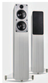
...и белого глянца

также не является чисто декоративным элементом. Эта часть конструкции, прижатая к передней панели кабинета через лист бутилового каучука, призвана дополнительно уменьшить уровень собственных резонансов корпуса АС. Передние опоры АС разнесены достаточно широко, и это также часть мероприятий по борьбе с резонансами. Стекло, выбранное в качестве материала опор, дает дизайнерский эффект компенсации их размеров. Задняя ножка крепится ко дну кабинета. Две пары клемм позволяют соединить систему по bi-wiring и bi-amping.