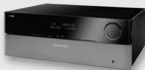
Интегрированный усилитель Harman/Kardon НК 990