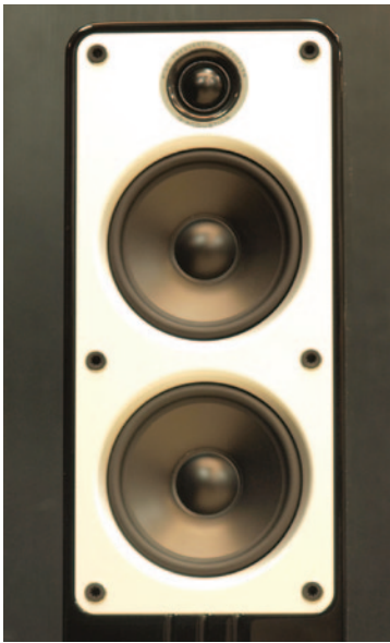
Группа излучателей собрана в верхней части кабинета

Динамики Концерт 40 (25-мм купольный твитер и пара СЧ/НЧ-излучателей диаметром 125 мм) укомплектованы мощными, негабаритных размеров магнитами, причем фиксация драйверов имеет свои особенности, направленные, в частности, на дополнительное снижение частоты резонанса. Результаты конструктивных ухищрений — чувствительность 90 дБ/Вт/м в сочетании с импедансом, который никогда не опускается ниже 4 Ом. Специалисты Q Acoustics утверждают, что Концерт 40 легко управляется любым хорошим усилителем. Приведенные ниже параметры заставляют признать, что это так и есть.