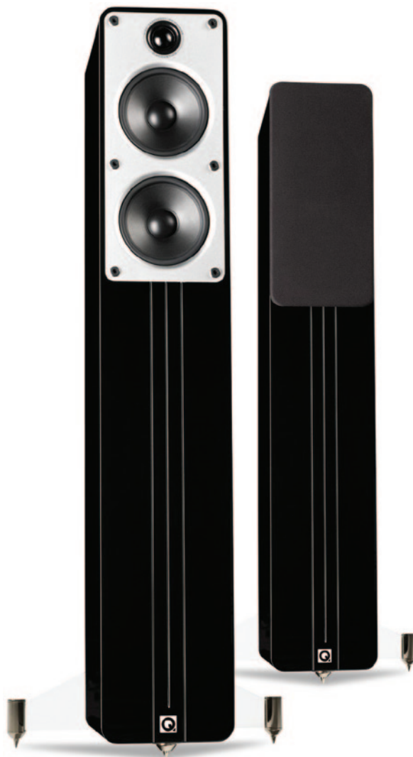
Q Acoustics Concept 40 в отделке из черного...

черном и белом глянце. Акустика, по словам разработчиков, призвана создавать «беспрецедентную звуковую сцену, динамику и чистоту музыкальности» благодаря своим уникальным драйверам, размещенным в низкорезонансном корпусе Gelcore. Если подробнее о примененной технологии, то стенки корпуса АС образованы двумя тонкими слоями МДФ, между которыми находится материал Gelcore (гелевое ядро или гелевая сердцевина — если в буквальном переводе). Слой Gelcore демпфирует колебания во внутреннем объеме, превращая их в тепло, что приводит к созданию необычайно «тихой» внешней поверхности кабинета — таким образом, нейтрализуются паразитные призвуки от стенок, накладывающиеся на звучание самих динамиков и искажающие его. Эта слоистая конструкция используется на всех панелях, кроме передней и задней — они изготовлены из панелей МДФ большой толщины. Переходная рамка из алюминия на передней панели